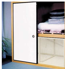
押入れ型シェルター