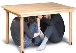
テーブル型シェルター